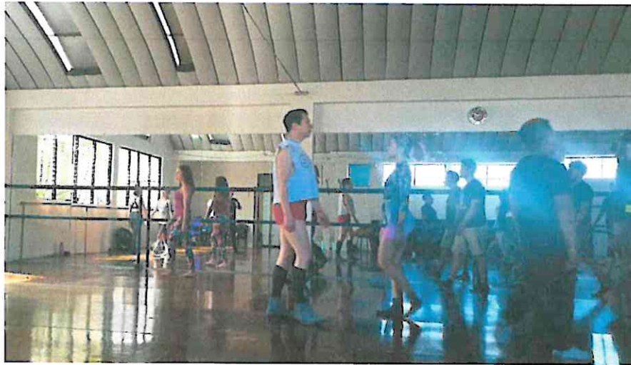
Taller de Técnicas de Interpretación Corporal y Técnicas de expresiones artísticas.