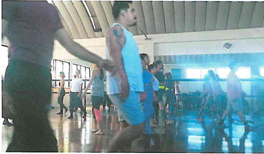
Taller de Técnicas de Interpretación Corporal y Técnicas de expresiones artísticas.